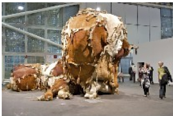
Zhang Huan- Hero núm. 1 , Art Basel

Cuando analizamos las gráficas de ventas por años, encontramos que el 2008 tuvo la posición más alta y