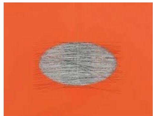
Jesús Soto Un hueco en lo anaranjado

La obra de Jesús Soto bate su propio récord: durante la subasta de arte latinoamericano; realizada por la casa Christie's. Se trata de Un trou sur l'orange ( Un hueco en lo anaranjado ), adquirida por 758.500 dólares; mientras que su marca previa era de 644 mil dólares, correspondiente a la obra Leño Viejo , vendida en Madrid por la casa Odalys, el 12 de febrero de 2009. Sin embargo, la agencia AP señala que la marca previa de Soto era de 657.924 dólares, aunque no se señala la obra en cuestión. ( www.lostiempos.com ) Recuperado 17 de diciembre