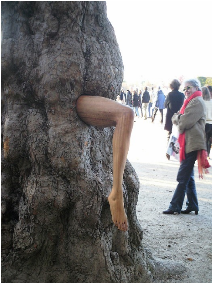
Feria FIAC, París- Obra de Allora y Calzadilla

instalaciones de varios módulos, de los más destacados artistas internacionales. En eventos como la FIAC, se puede apreciar la amplia gama de medios, técnicas y contenidos así como de planteamientos estéticos en presentaciones innovadoras al igual que nuevos enfoques de los medios tradicionales como la pintura, la escultura y la fotografía, entre otros. Se presentan piezas como instalaciones en las que se puede cuestionar las posibilidades de compra/venta ya sea por ser aparentemente efímeras o temporal.