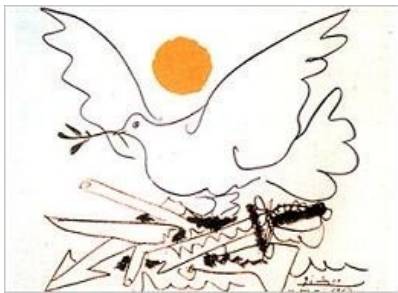
Picasso, Paloma de la Paz

Se requiere la existencia de determinada supraestructura ideológica de la sociedad; es decir, de un conjunto de ideas, creencias, normas o valores (o ideología estética), que justifique y guíe el comportamiento estético de los hombres (como un comportamiento distinto de otros: moral, religioso, político, etcétera), así como de las instituciones- escuelas, mercado, academias, etcétera- correspondientes.