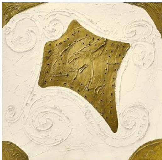
Lucio Fontana Concetto Spaziale Sotheby's London Contemporary art sale

aunque han bajado las ventas aún en el 2010 hay un nivel económico significativo.