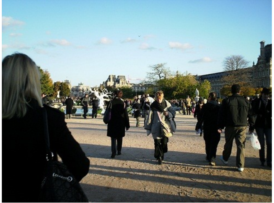
FIAC, esculturas y público en Les Tuilleries, París

La FIAC 2010, se llevó a cabo desde el 20 hasta el 23 de octubre en París, en tres lugares distintos. Estuvo ubicada en el amplio y céntrico espacio del Gran Paláis al igual que en gigantescas carpas cerradas en los predios del Museo del Louvre. Las esculturas de gran tamaño de los 28 proyectos incluidos, se encontraban dispersas por todo el inmenso parque de Les Tuilleries . Participaron 114 galerías de arte entre las más prestigiosas del mundo, mostrando las obras de diversos tamaños hasta grandes