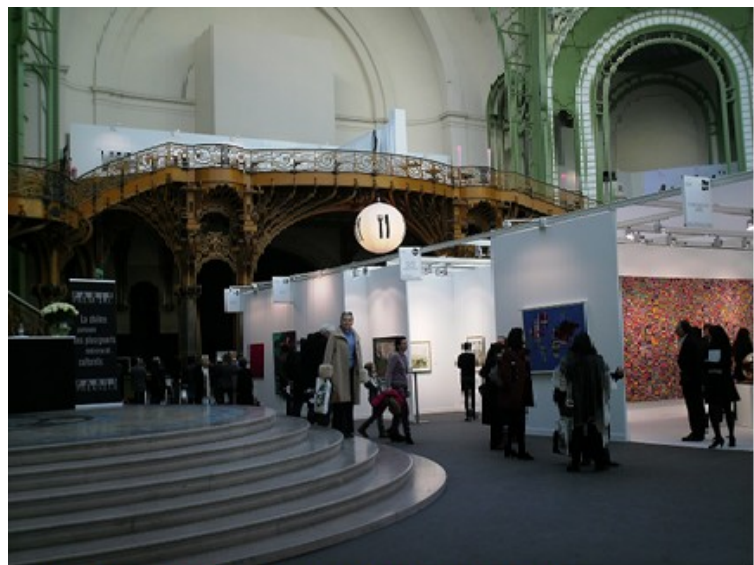
Feria FIAC, Grand Palais, Paris

Precisamente se celebró este mes Art Basel en Miami, la cual fue visitada por varios coleccionistas y profesionales en las artes de Puerto Rico. La Feria de arte CIRCA , de San Juan, una de las más recientes y que se ha celebrado por algunos años, tuvo que cancelar la edición del 2011, por razones económicas. ( www.elnuevodia.com . 12 de octubre de 2010. (Recuperado 15 de diciembre de 2010) Entre las más importantes a nivel mundial y de mayor éxito y extensión en todos los aspectos, ARCO en Madrid, en la que anualmente se le