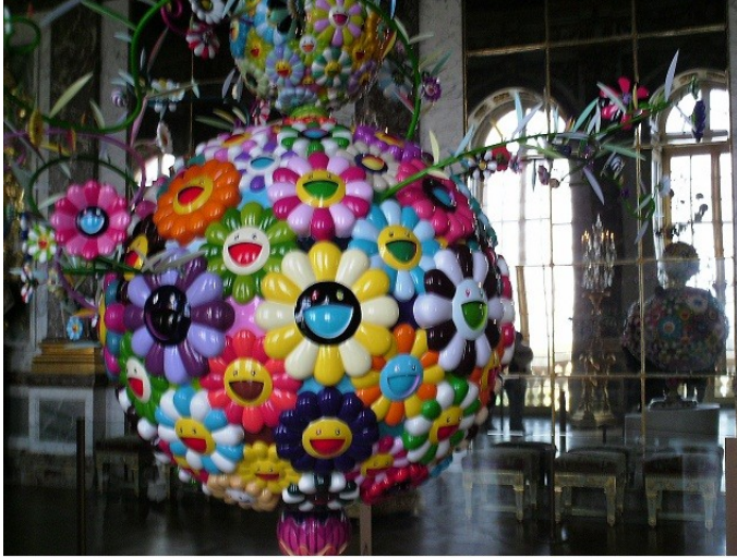
Takashi Murakami- Flower Matango 2001-2006 (en Versalles)

Art Unlimited , una esfinge -de unos casi diez metros- del artista chino Zhang Huan , al artista japonés Takashi Murakami , por un precio de 1,5 millones de euros. ( www.lamajadescalza.com )